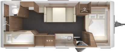
SENARA 620 DMK 2,5