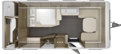
CAZADORA 560 HTD 2,5