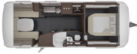
CELLINI 655 DF 2,5