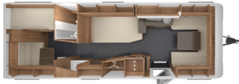
DA VINCI 700 KD 2,5