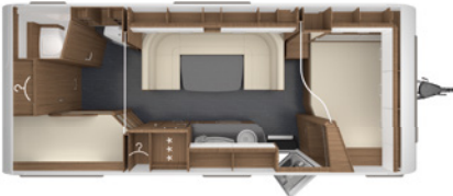
SENARA 620 DMK 2,5